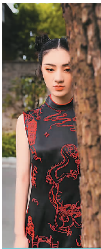
图片从左至右依次为： 苏州可园（郑娜摄）、 园林版昆曲《浮生六记》 （演出方供图）、苏州双塔市集 （来自网络）、苏绣旗袍 （苏州丝执文化有限公司供 图）、苏州美食（来自网络）