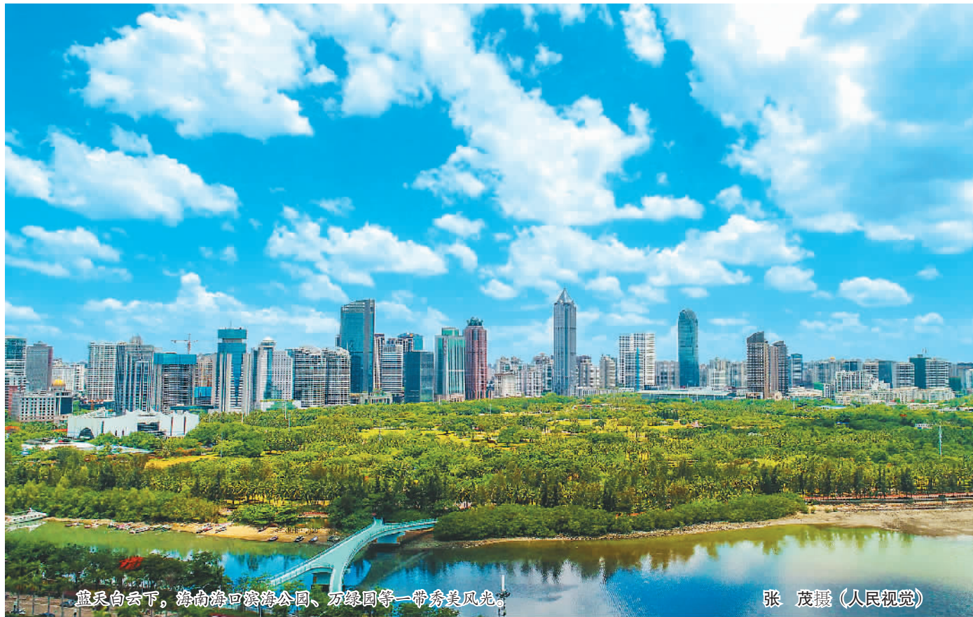
蓝天白云下，海南环岛自驾公路、万绿园等一带风景如画。

提“气质”绝非朝夕之事。中共十九大把污染防治攻坚战列为全面建成小康社会三大攻坚战之一，而蓝天保卫战是重中之重。