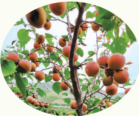
当年绿化的窝窝井村荒地已经结出了累累果实。