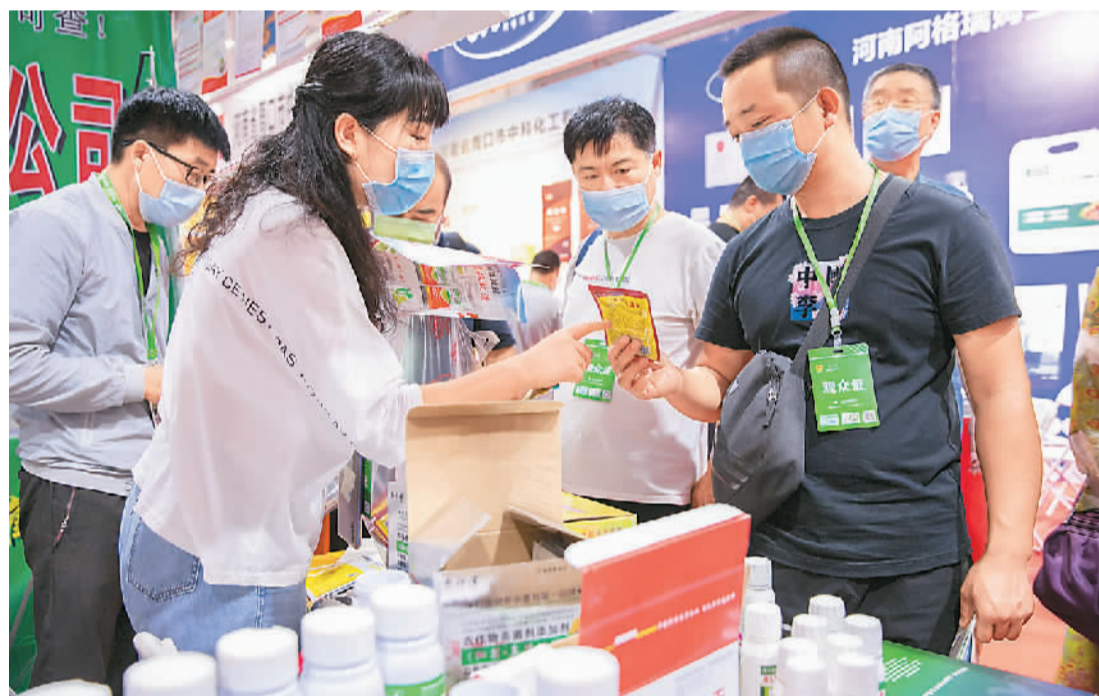
8月1日，为期3天的2020第二十六届内蒙古农业博览会在位于呼和浩特的内蒙古国际会展中心开幕。本次博览会设置农资、节水灌溉、农牧业机械、苗木花卉、农林产品、金融服务六大展区，吸引了全国400余家参展商参展，展示展销总面积近1.5万平方米。图为参观者在博览会上选购创新型植物增产剂。

“下阶段，随着疫情防控和经济社会发展各项工作统筹推进，宏观政策效应进一步显现，经济逐步恢复，文化消费需求将回补释放，文化市场回暖向好态势将持续巩固，文化企业生产经营有望逐步改善。”辛佳说。