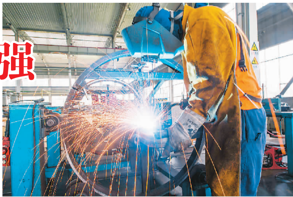
图为近日工人在山东省青州市一机械制造企业车间内进行焊接作业。

特别要引起注意的是，7月份原材料库存指数为47.9%，从业人员指数为49.3%，均在临界点之下。张立群认为，库存水平