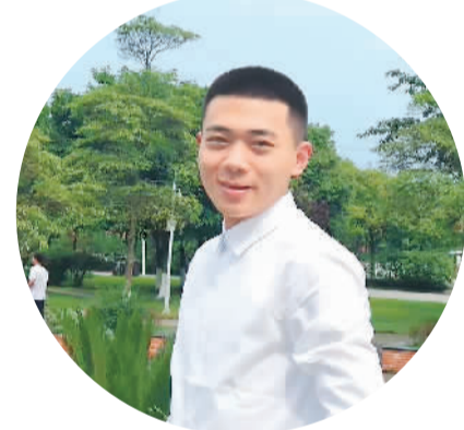
▼ 余煜宸 黄自宏摄