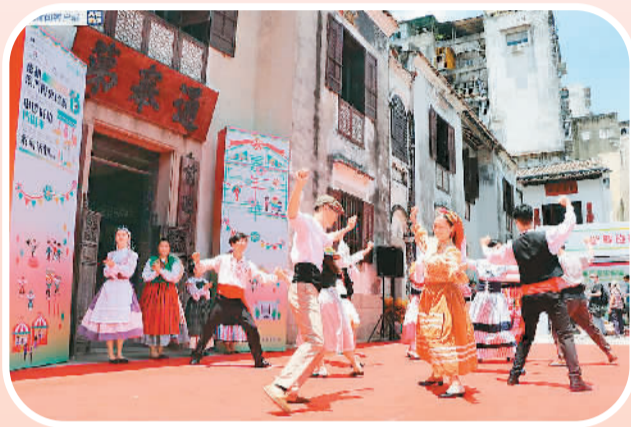
吸引众多澳门市民和游客驻足。 (资料图片)

教科文组织第29届世界遗产委员会在南非德班举行会议，一致同意将澳门历史城区作为世界文化遗产列入《世界遗产名录》。15年来，澳门特区政府日益重视保护和合理开发历史城区，澳门市民对世界遗产的认识和保护意识不断加强，澳门历史城区不断焕发新活力。