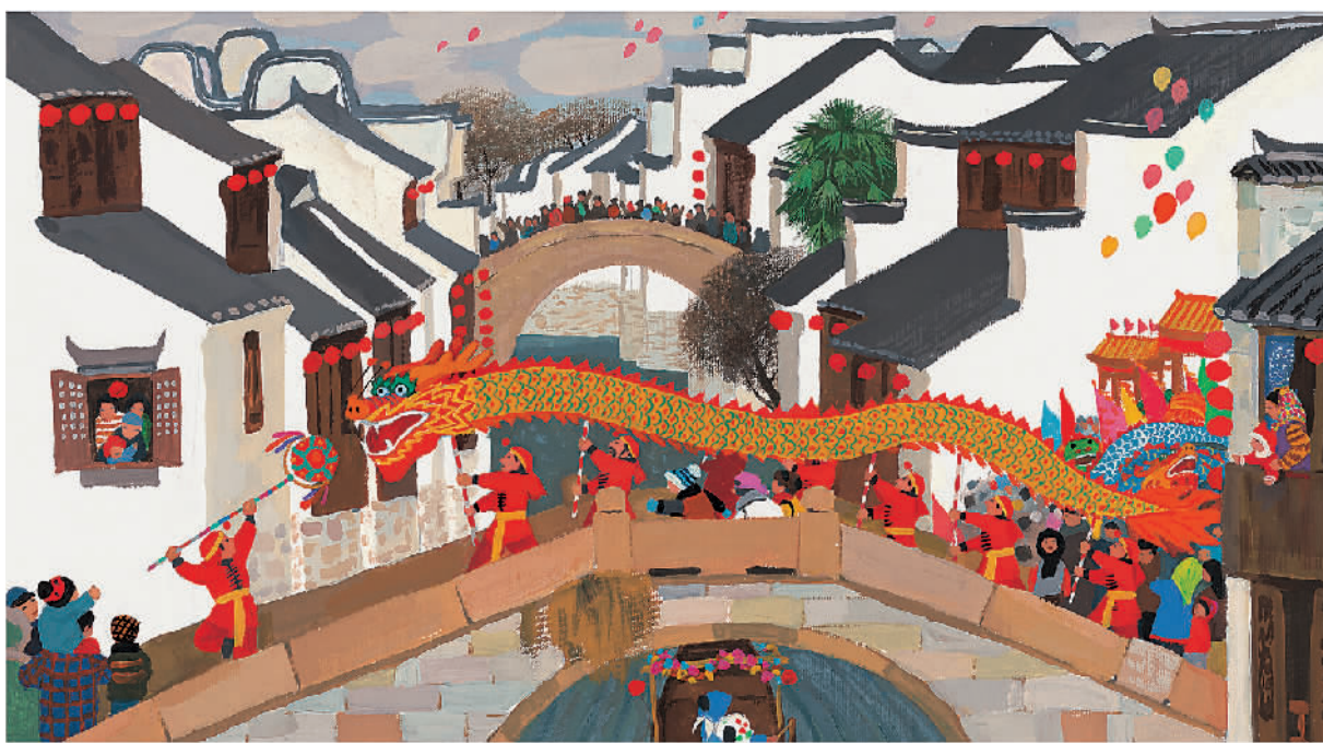
《团圆》内页插画 余丽琼文 朱成梁绘