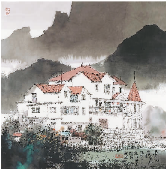
大湾村农家新居(中国画)刘建作

2020年是全面建成小康社会和“十三五”规划的收官之年，也是脱贫攻坚的决胜之年。日前，由中国国家画院主办的“春华秋实——中国国家画院扶贫主题采风写生作品展”在京举行。61位艺术家创作的