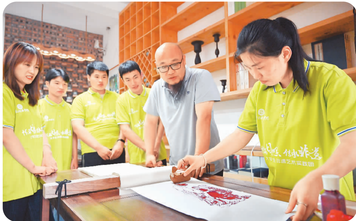
山东水利职业学院大学生非遗艺术实践团向非遗传承人学习、体验雕版印刷技艺。

跨省（区、市）团队旅游恢复已有一周，全国各地接连传来好消息，游客出游热情高涨，旅游热度攀升，市场回暖，旅游整个产业链全面复苏。旅游业在欢欣鼓舞的同时，也有着理性清醒的分析：如今，旅游市场已经发生改变，定制化、个性化、主题化等趋势更加显著。对旅游企业而言，复苏后不能重走老路，创新调整已是必然的选择。只有高品质旅游产品才能长久赢得市场。在文旅融合日益深入的当下，许多旅游企业选择深耕中国传统文化。