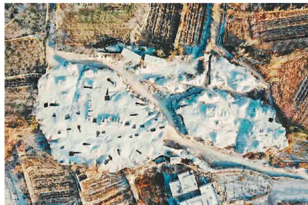
拉甫却克墓地考古现场。

拉甫却克墓地于新疆哈密市伊州区五堡镇博斯坦村，共有62座墓葬散布在白杨河中游东岸台地上。(据新华网)