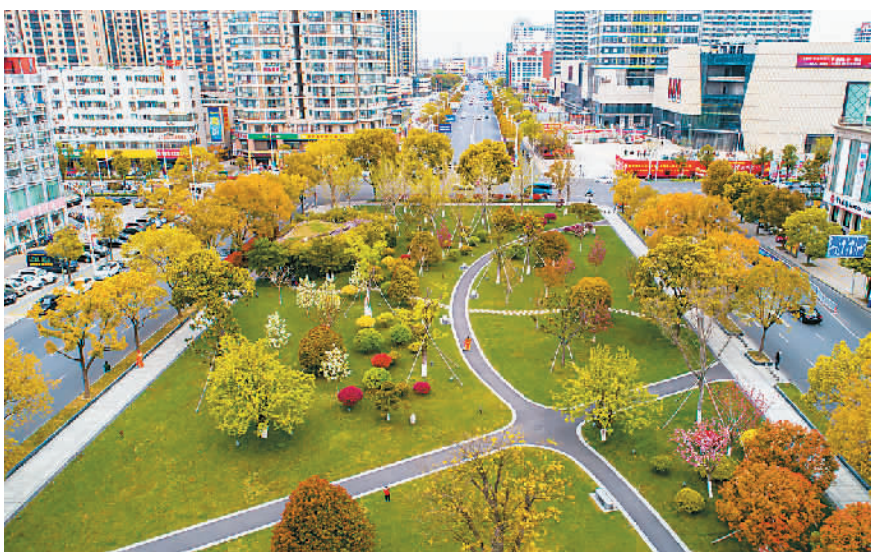
江苏海安市新世纪广场上的小公园。

“我们突出对精神文化的追求，每个公园都有一种精神表达。比如，瑞园展示的就是井冈山精神。”可不！形态各异的景观小品向市民传递着红色的精神，其中一组刻画着井冈山精神内涵的山状景石尤为引人注目。