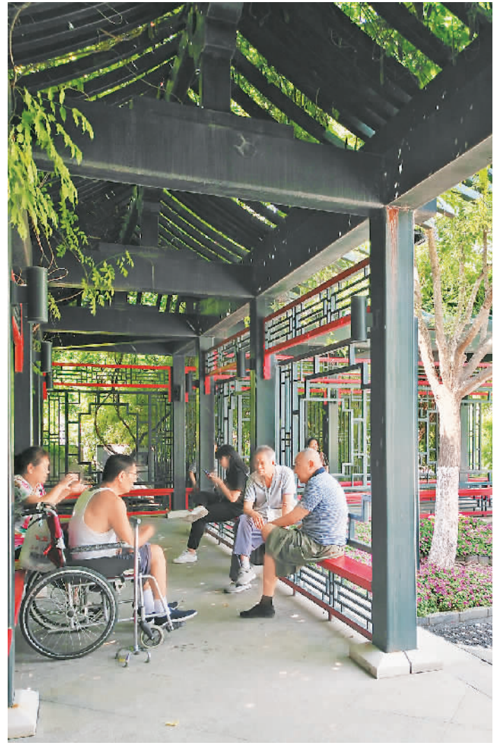
▲居民在北京西城区京韵园（一期）长廊中闲聊。