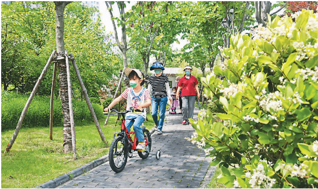
市民在山东青岛市北区口袋公园“昌乐园”游玩。