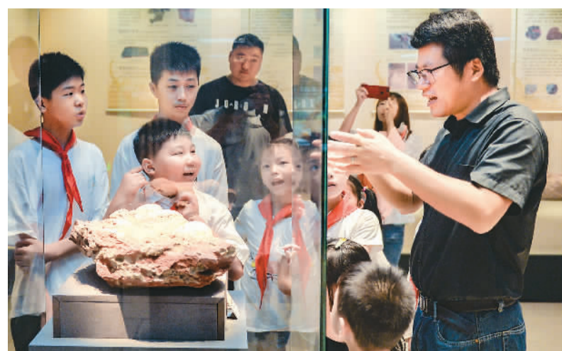
浙江省湖州市长兴县太湖街道近日开展“春泥计划”暑期公益夏令营活动,组织社工、青年志愿者免费为农民工子女、留守儿童提供科普发明、非遗体验等特色课程学习。图为志愿者带领孩子们参观太湖博物馆恐龙科普展。

据共建方介绍,基地挂牌后,深圳海外联谊会将邀请港澳社会团体和学校共同发起研修计划。让港澳青少年深入了解宪法和港澳基本法,通过深圳这个“窗口”深入了解内地经济、社会和法治建设成就。