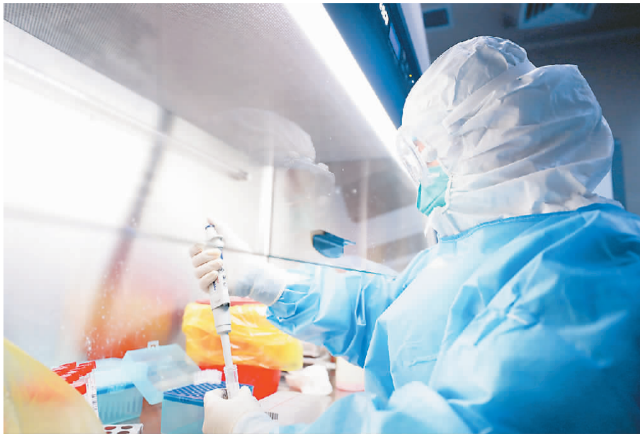
北京天坛医院两个PCR实验室全速运转，准确筛查出多名新冠肺炎患者。