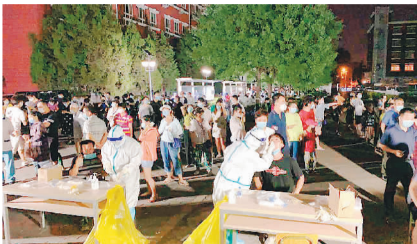
北京市丰台区一处集中采样点，北京天坛医院核酸采样队连夜为居民采集咽拭子。

在发热门诊，来自各科室的医护人员支援力量迅速补充到位，发热门诊、感染科病房全速运转；为了缓解人员聚集和人流交叉，医学