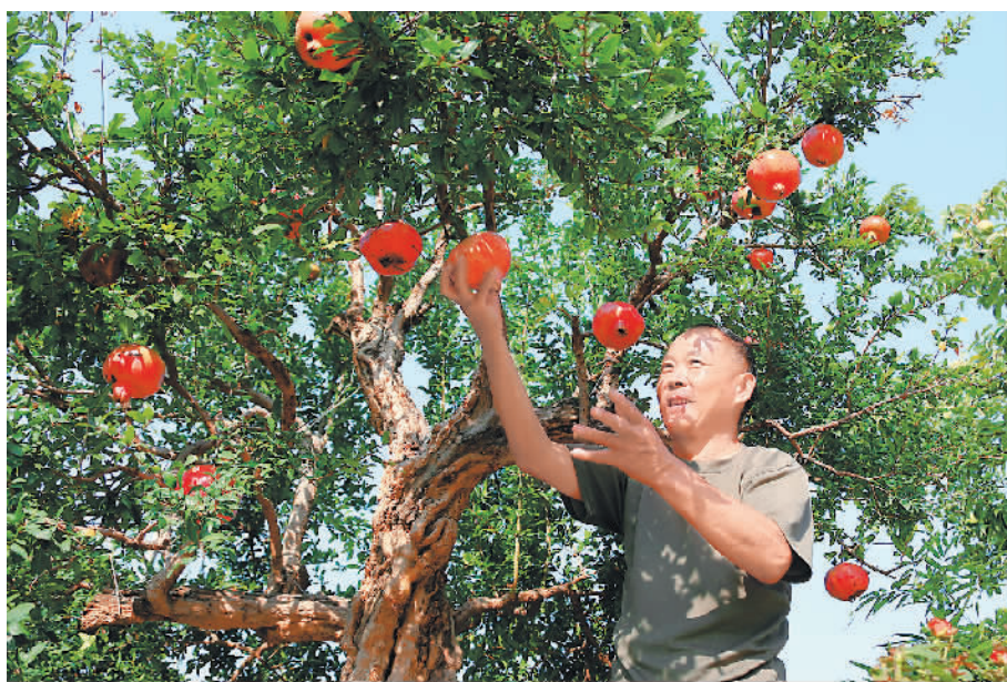
上图：石榴花开红艳艳。资料图片 下图：在峯城石榴园，果农正在采摘石榴。吉喆 秦庆国摄（人民图片）

石榴花在一派绿中火辣辣地盛开，喷薄怒放如一团团熊熊燃烧的火焰，让人为之振奋，也给文人们带来灵感。晋人潘岳作有《安石榴赋》，其序云：“榴者，天下之奇树，九州之名果也。”梁元帝萧绎在《咏石榴诗》中形容石榴“叶翠如新剪，花红似故裁”。诗仙李白在峯