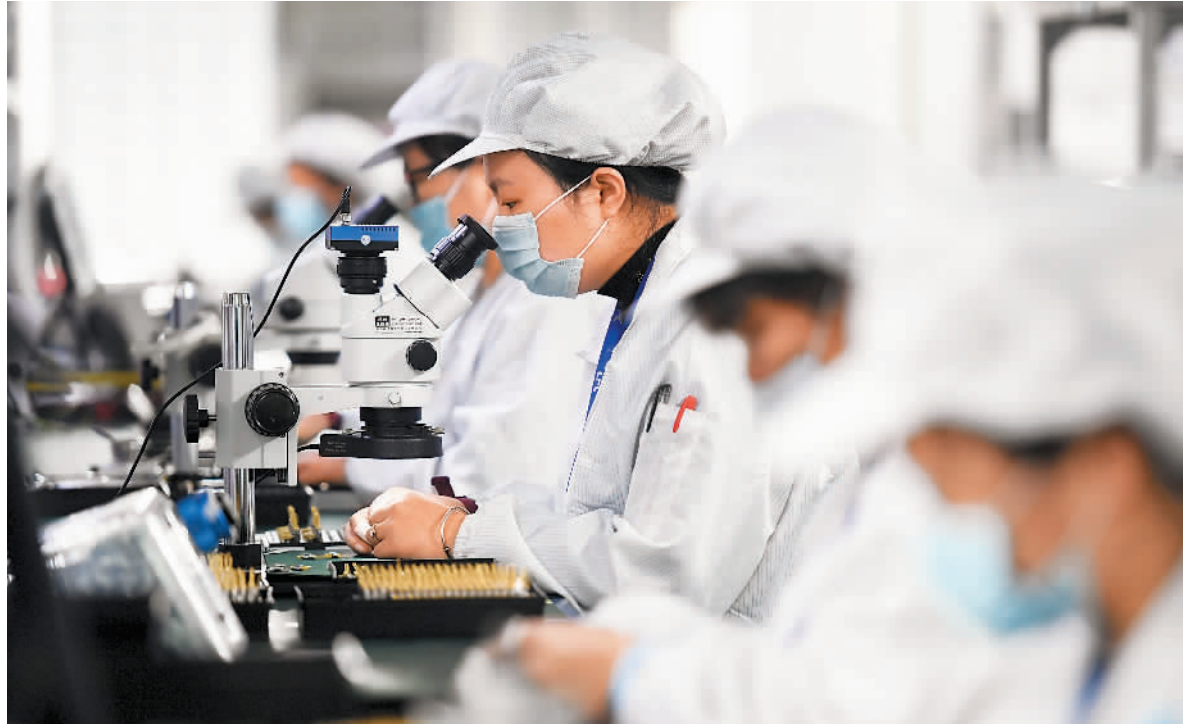
图为4月26日，江西省高安市天孚光电技术有限公司的工人们正加紧赶制5G光纤连接器部件。