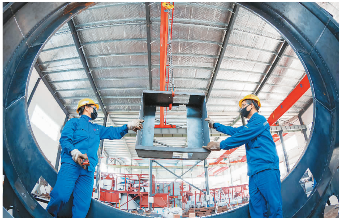
图为5月17日，在江苏省海安市白甸镇一企业车间内，工人们正在赶制建材装备订单。