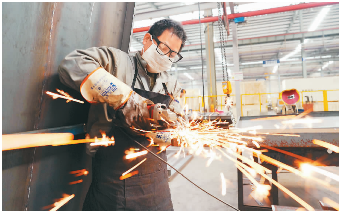
图为4月3日，在浙江省湖州市南浔经济开发区的怡达快速电梯有限公司车间内，工人正加紧生产一批发往海外的电梯部件。