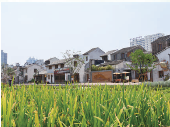
▲遗址回填保护区与社区融为一体。