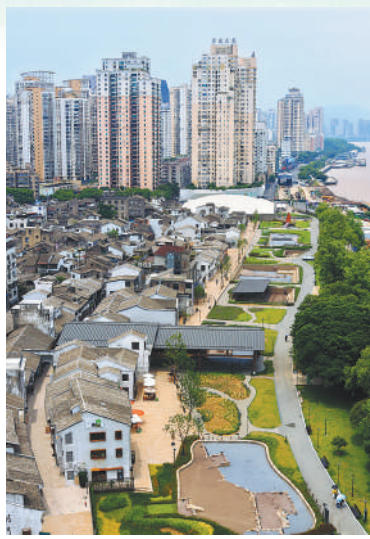
▶温州朔门古港考古遗址公园俯瞰。