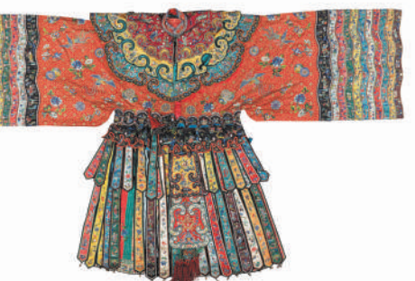
▲清代缂地彩绣舞衣。