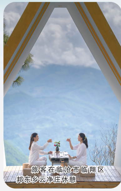
旅客在临沧市临翔区邦东乡云净庄休憩