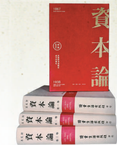
左图为重庆民生路读书出版社分社老照片(摄于1939年)，右图为复刻版《资本论》纪念套装。