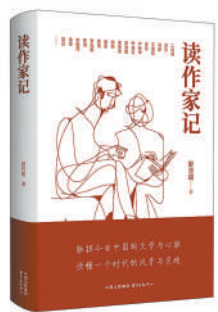
《读作家记》：舒晋瑜著；东方出版中心出版。

本书从时代内涵、文化渊源和实践样本维度，探索经济和人文相互促进、共同繁荣的深层逻辑。