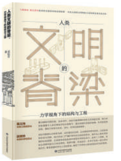
《人类文明的脊梁：力学视角下的结构与工程》：武际可著；山东科学技术出版社出版。

衷心希望有更多的科学家和教育家投身于科普事业，让科学的光芒照亮更多人的心灵。 (作者为中国工程院院士。此文为《人类文明的脊梁：力学视角下的结构与工程》一书序言，本版有删节，标题为编者所加。)