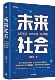
《未来社会》：邵春堡著；中信出版社出版。

我们从未像今天这样深刻地感受到人类文明的变革力量。技术浪潮汹涌澎湃，人工智能、生物科学、太空科技等领域日新月异；全球化深入发展，形成你中有我、我中有你的命运共同体。另一方面，生态危机、技术风险、社会矛盾等问题随之产生，那些曾经推动人类文明进步的治理模式和秩序框架，面临前所未有的冲击。这一背景下，深入思考未来社会走向，探寻人类文明进化路径，成为社会关注的重要课题。