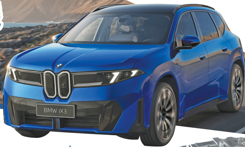
宝马新世代车型按照“循环设计”思路，从源头减碳