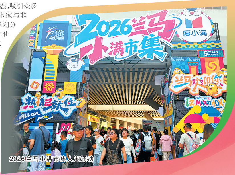
2026兰马小满市集人潮涌动