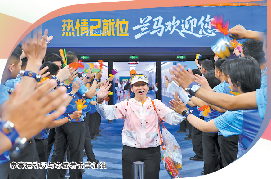
参赛运动员与志愿者击掌加油