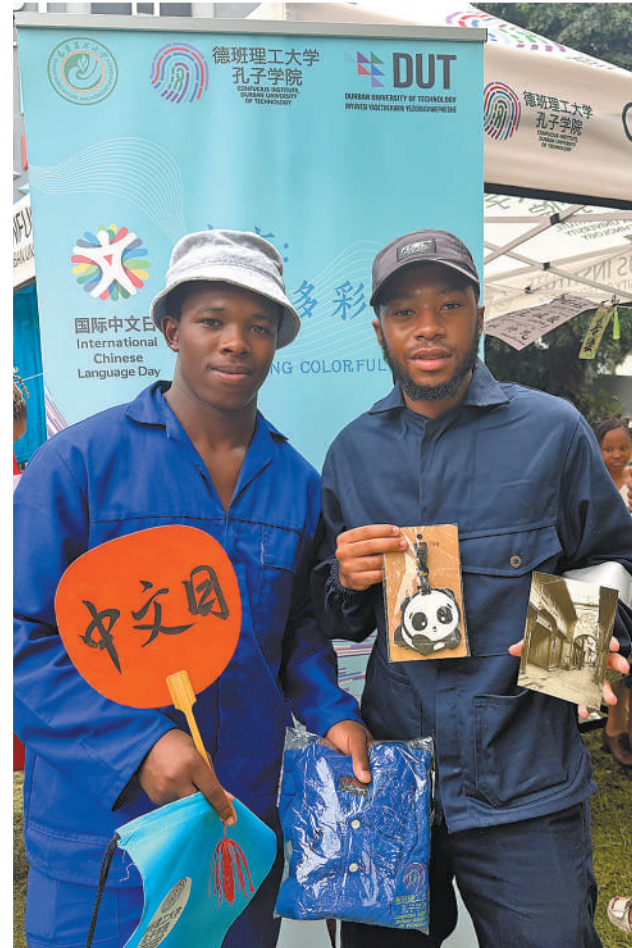
▲在南非德班理工大学孔子学院举办的2026年“国际中文日”活动上，当地学生展示熊猫元素挂件、中国书法团扇等文创产品。