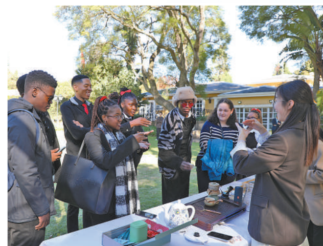
▲在中国驻约翰内斯堡总领馆主办的“中国式现代化与非洲发展——中国驻南非使领馆青年外交官与南非金山大学学生对话会”上，来自金山大学的学生体验中国茶艺。