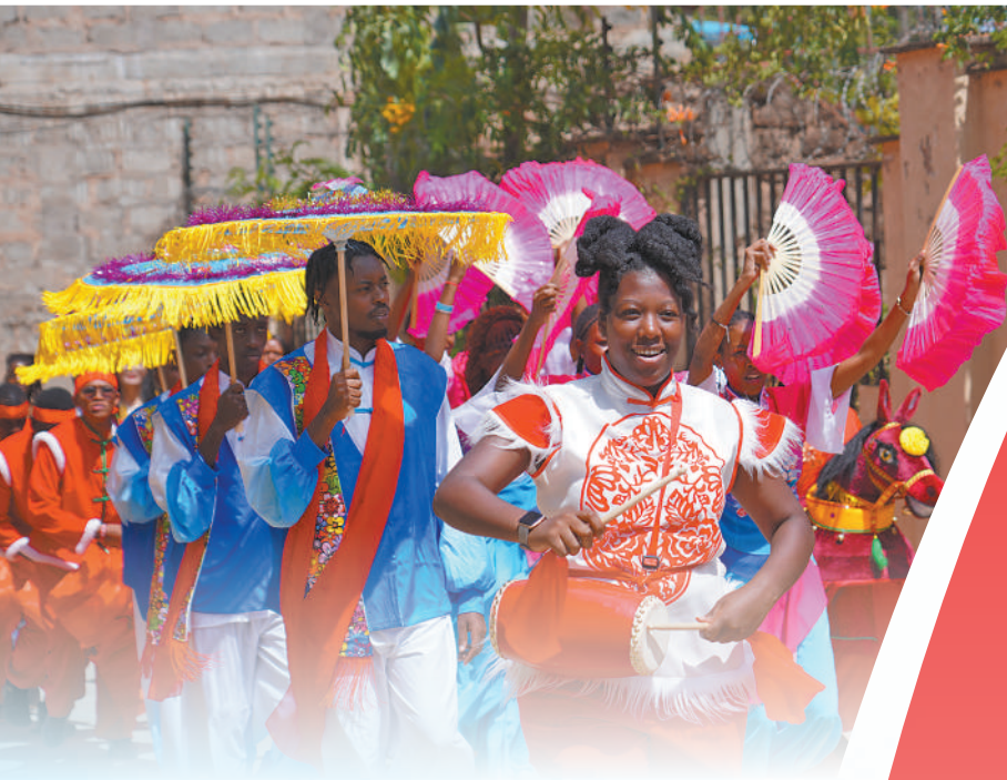
▲在肯尼亚内罗毕大学孔子学院举办的中国传统节日庆祝活动中，学生鼓乐社团、舞狮社团与舞蹈社团联袂表演秧歌。

2026年是中非开启外交关系70周年，也是双方共同确定的“中非人文交流年”。以此为契机，中非共同举办一系列丰富多彩的交流活动，充分彰显了中非人民之间日益紧密的纽带、不断深入的友谊，将继续促进28亿多中非人民心相通、情共融、力同聚。