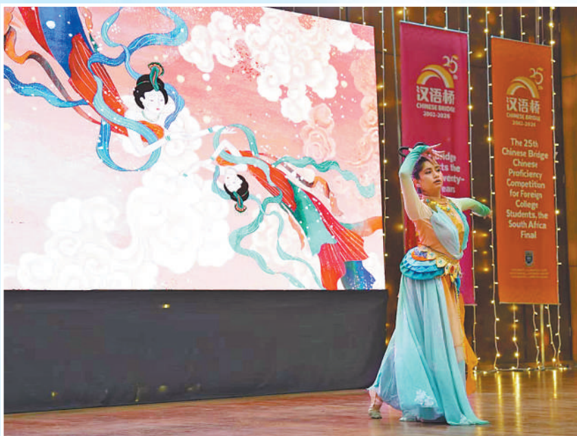
▲日前，第二十五届“汉语桥”世界大学生中文比赛南非赛区决赛在西开普大学孔子学院举办。图为参赛选手表演中国传统舞蹈。