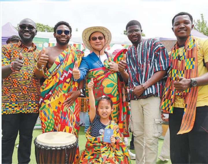
▲5月23日，清华大学举行第十四届国际文化节暨“地球村”国际文化博览会。图为现场观众体验加纳传统服饰肯特布和非洲鼓。