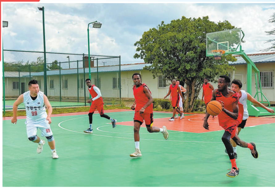
▲日前，肯尼亚铁路局与蒙内铁路运营方非洲之星铁路运营公司举办中肯员工篮球友谊赛。

人民友好是非中关系的重要基石，人文交流是非中世代友好的动力源泉。立足七十载全天候友好合作根基，以2026年“中非人文交流年”为契机，非中双方深化各领域务实合作，必将为携手推进现代化建设注入更多活力，为构建新时代非中命运共同体夯实根基，续写非中世代友好、共赢发展的崭新篇章。