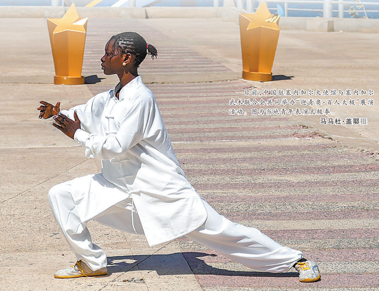
▲日前，中国驻塞内加尔大使馆与塞内加尔武术联合会共同举办“迎青奥·百人太极”展演活动。图为当地青年表演太极拳。