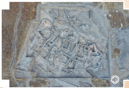
图①:苏峪口瓷窑址全景航拍图。

遗址发掘完成后,通常需要进行回填以保护本体。但若只是简单回填,地表恢复原状,公众便再难有机会感知苏峪口瓷窑址的文化和民族交融研究提供了实证。”