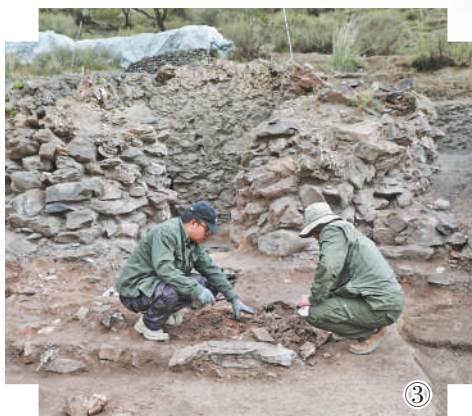
图③:考古人员在窑窑址进行发掘。

面对重重困难,团队积极引入现代科技手段。三维扫描、无人机摄影测量等新技术全程跟进,确保数据记录的完整性和准确性。在长达9年的考古研究中,团队逐渐理清了窑场的格局、瓷器的烧造工艺以及窑业的兴衰脉络。