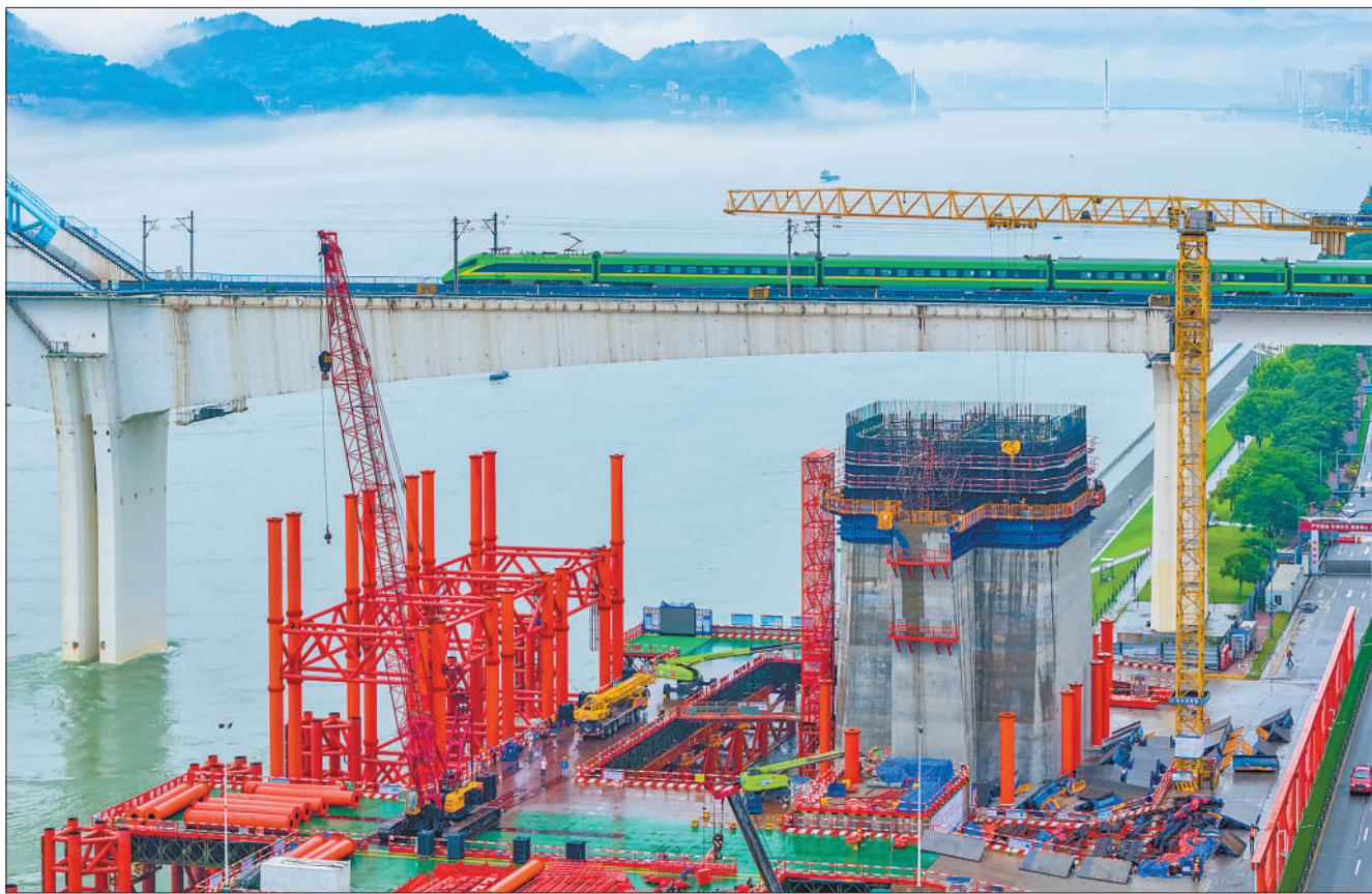
5月26日,湖北宜昌长江公铁大桥建设现场机器轰鸣,一派繁忙景象。大桥采用铁路在上、公路及轨道交通在下的分离式钢桁梁斜拉桥结构,创新应用独柱式组合主塔设计。这座大桥与既有宜万铁路大桥并行,是沪渝蓉沿江高铁宜昌段的关键控制性工程。

据介绍,2024年至今,“学习强国”学习平台先后开展了《沿着边境看中国》《沿着海岸看中国》《沿着黄河看中国》等系列融媒体报道。“学习强国”与一九零五(北京)技术服务有限公司共同推出的行走中国频道以“行走”为主线,以沉浸式、行进式、体验式、讲述式为特色,结合中央媒体主题调研活动、地方联动报道、专家学者解读、网络达人探访等形式,展现各地在高质量发展、美丽中国建设进程中的创新实践、典型经验和突出成效,为用户打造感知新时代中国发展脉动的窗口。