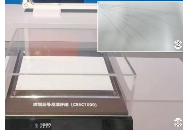
图①、图②分别为“九天揽月——中国探月工程20年”展览展出的月壤纤维样品和月壤纤维细节放大图。

目前，月壤制纤仍停留在基础验证阶段，距离实际应用尚有时日。此次纤维实验样品进入空间站，正是要在真实宇宙环境中，测试它能否经受住太空环境的严酷考验。每一组数据，都将为未来在月球表面建造人类家园积累宝贵经验。