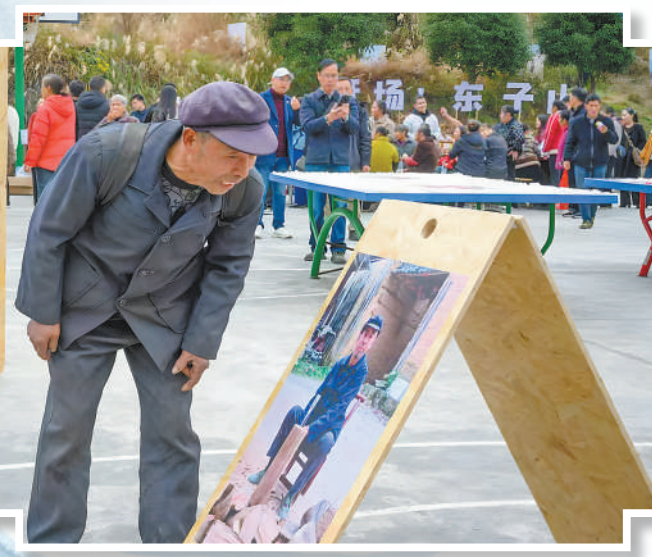
▲东子山村村民在乡村摄影展中观看自己的肖像照。