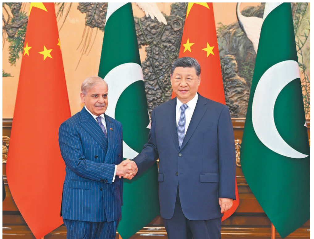
五月二十五日下午，国家主席习近平在北京人民大会堂会见来华进行正式访问的巴基斯坦总理夏巴兹。

【新华社北京5月25日电】5月25日下午，国家主席习近平在北京人民大会堂会见来华进行正式访问的巴基斯坦总理夏巴兹。 习近平表示，中巴建交75年来，两国相互理解、相互信任、相互支持，锻造了牢不可破的传统友谊，双方战略互信和务实合作有力促进各自国家发展。无论国际形势如何变化，中方始终将发展中巴关系置于周边外交的优先方向。不久前，我收到天津大学巴基斯坦留学生的来信。同学们立志做中巴合作的建设者、交流的传播者、友谊的守护者。看到两国友好事业后继有人，我感到十分欣慰。双方要加快构建新时代更加紧密的中巴命运共同体，让两国全天候合作取得更多成果，更好造福