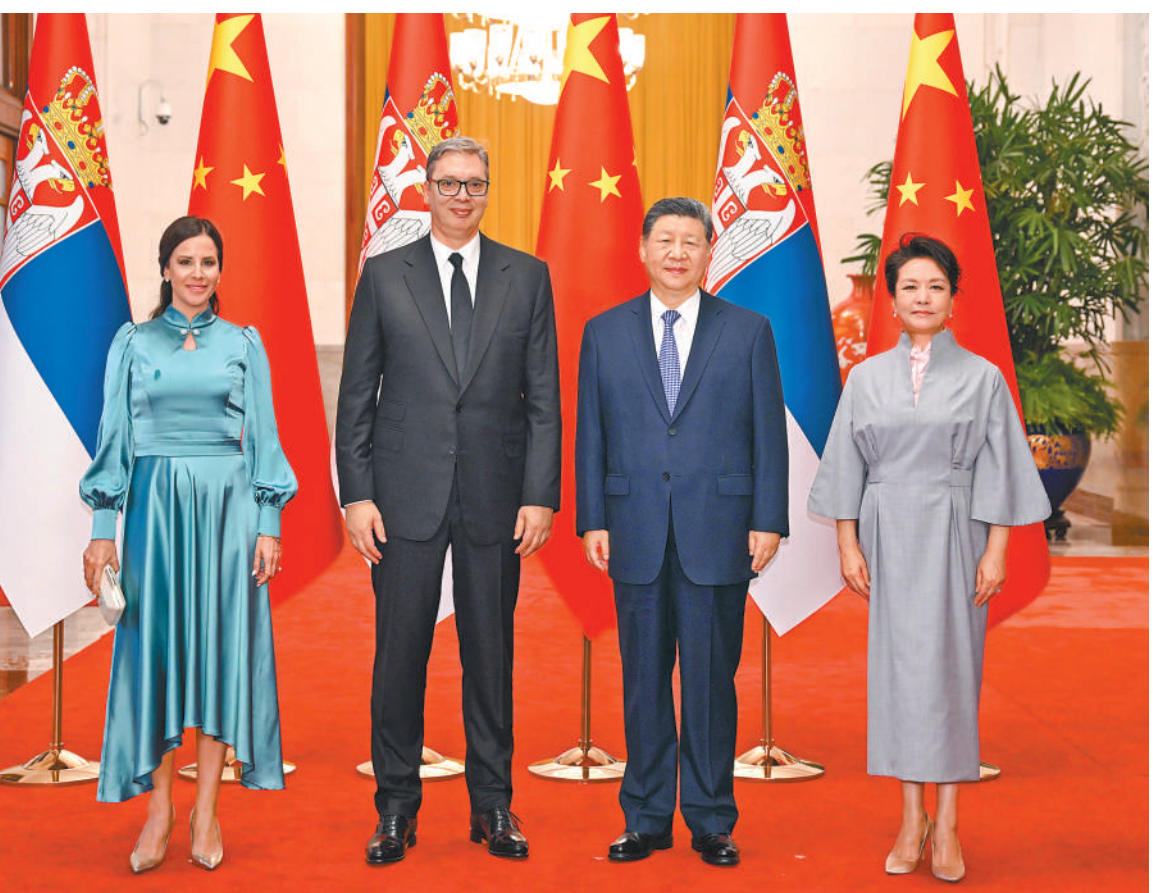
五月二十五日下午，国家主席习近平在北京人民大会堂同塞尔维亚总统武契奇夫妇举行会谈。这是会谈前，习近平和夫人彭丽媛同武契奇夫妇在人民大会堂东大厅为武契奇夫妇举行欢迎仪式。