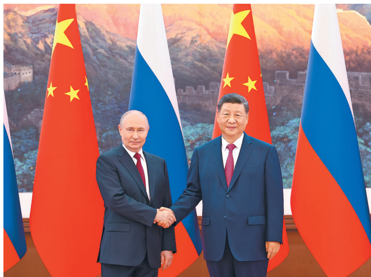
5月20日上午,国家主席习近平在北京人民大会堂同来华进行国事访问的俄罗斯总统普京举行会谈。