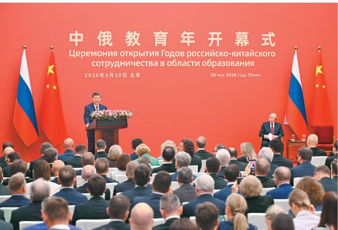
五月二十日下午,国家主席习近平同俄罗斯总统普京在北京人民大会堂共同出席“中俄教育年”开幕式。

本报北京5月20日电 (记者杨翊楚)5月20日下午,国家主席习近平同俄罗斯总统普京在北京人民大会堂共同出席“中俄教育年”开幕式。两国元首在热烈的掌声中一同步入会场。