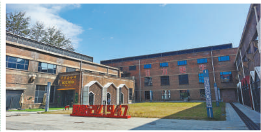
▲“阳泉记忆·1947文化园”内景。