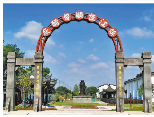
▲中国醋文化博物馆外景。