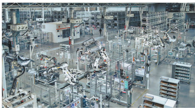
▲小米汽车工厂内的全自动加工装配线。

据统计，自2024年3月启动参观服务，并于同年11月正式向社会开放以来，小米汽车工厂累计接待游客突破23万人次，近5个月的月均接待量超过1万人次。