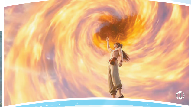
图①：制作中的三维AI动画项目分镜关键帧。