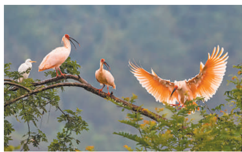
群栖翠枝的朱鹮。

本书构建了“地理+文化”的双重叙事框架，以中国广袤国土上鲜明的“三级阶梯”地形格局为经纬，将80种珍稀动物精准锚定在独特的生态家园与文化坐标中，编织出一幅全景式的中国生态与文化画卷。从青藏高原的雪豹、藏羚羊，到云贵高原的黑颈鹤、滇金丝猴，再到丘陵平原的朱鹮、东北虎，这种依循海拔与地貌变化的逻辑编排，带领读者奔赴一场从世界屋脊到海陆边缘的生态巡礼，在深入认识珍稀动物的同