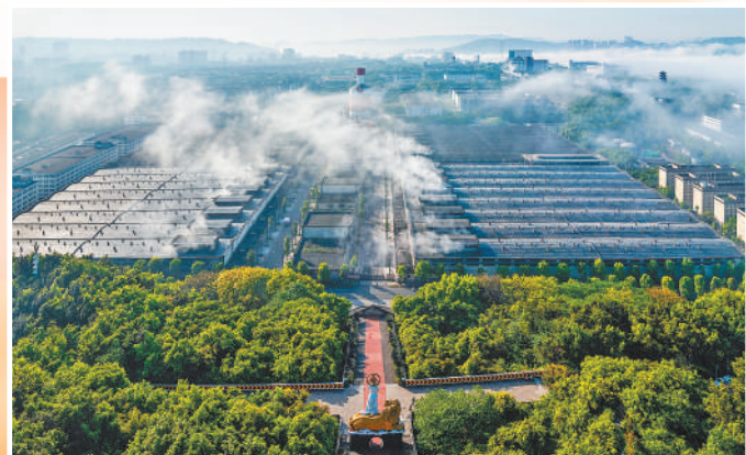
五粮液生态园区。广东阳江海城,阳江三山岛海上风电梁直输电工程海上换流站导管架精准落座预定海床,顺利完成安装。