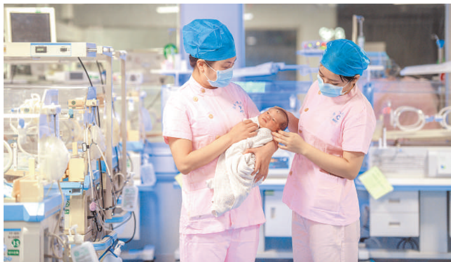
“五一”假期，许多劳动者坚守岗位，苦干实干、敬业奉献，为推动经济社会高质量发展贡献自己的力量。