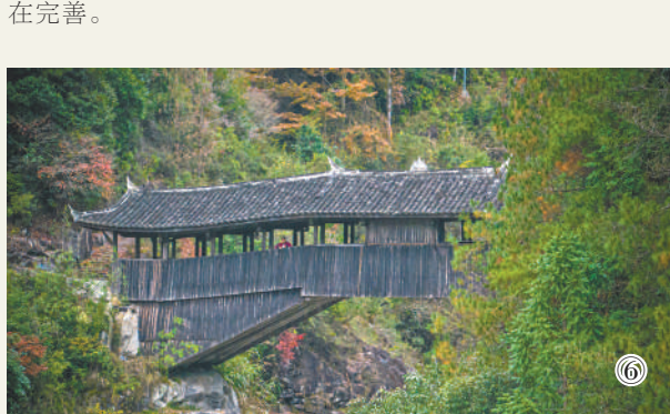
图①:非遗代表性传承人在教孩子唱伊玛堪。图②:吴宝臣在表演伊玛堪。图③:赫哲族村民在渔船上举行民俗活动。图④:美丽的赫哲族新村敖其湾村。图⑤:黎锦元素手工艺品。图⑥:浙江泰顺县西阳镇的三条桥。

2021年,《温州市泰顺廊桥保护条例》正式施行后,围绕“桥”也“护”“艺”这一主线,廊桥保护的多元共治体系正在完善。