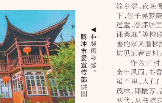
▲和顺图书馆。

百年风华，和顺图书馆涵养了崇文重教的一方水土，孕育出生生不息的文化根脉，彰显了爱国爱乡、情系桑梓的家国情怀。岁月流转，书香依旧。