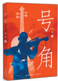
《号角》：何南著；晨光出版社、人民日报出版社出版。

2024年国庆期间，在玉溪聂耳音乐广场提供的巨大信息量面前，我一时不知所措。广场中心为小提琴形状，琴头处是聂耳铜像，铜像被设计成聂耳拉小提琴的姿势。琴声日夜在天地间回响，这琴声从心底流出，也从血管涌出。我印象最深的是，