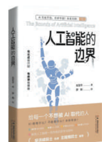
《人工智能的边界》：王耀南著；湖南科技出版社出版。