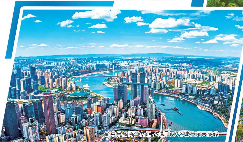
渝中半岛两江交汇,勾勒山水之城壮阔天际线