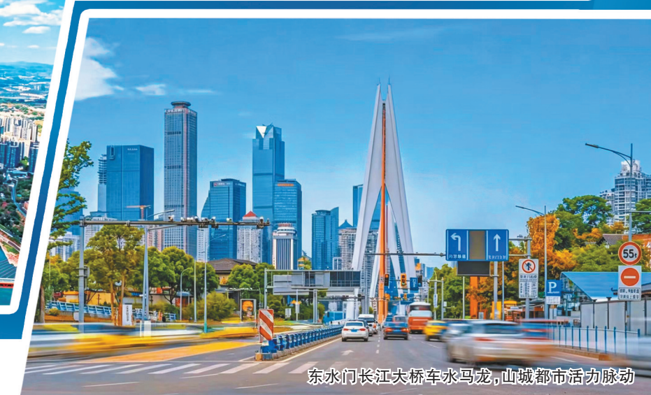
东水门长江大桥车水马龙,山城都市活力脉动

带,做强桥隧智慧管养,开展低空智能巡查,让“桥都”更具“智治”成色。守护桥隧设施安全,筑牢城市运行“骨架”。建成2823座桥梁、242座隧道全要素基础信息库,接入8058个物联传感设备,实现30个区县在线监管、全域覆盖,结构设施定期检测应检必检率超98%,闭环处置安全事件110件。“桥隧智慧管理”应用让AI化身“数字管家”,24小时守护桥隧安全运行,让每一座跨江大桥、每一条山地隧道都可感、可知、可控。