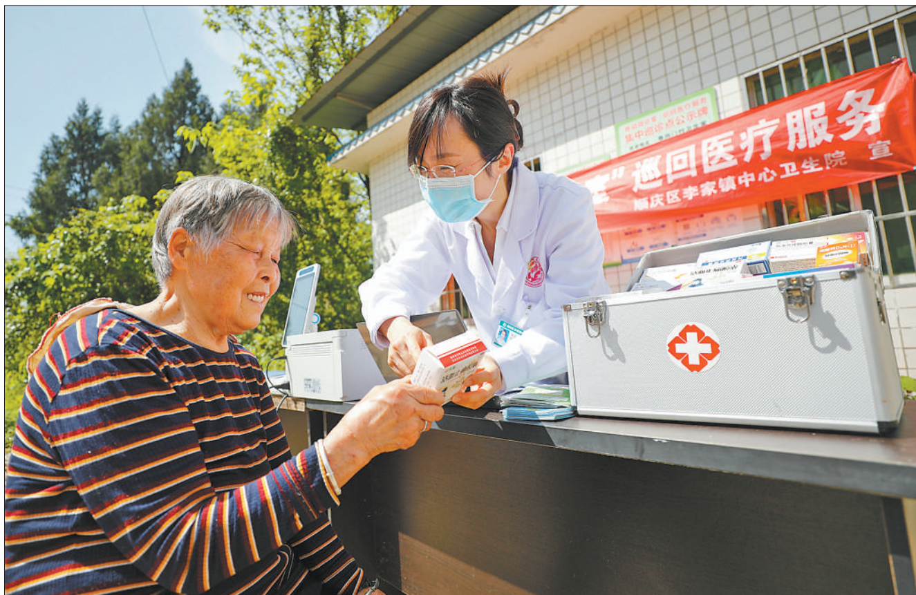
在四川省南充市顺庆区李家镇卷洞门村集中接诊点,当地中心卫生院巡回医疗组的医务人员正为村民开展常见病诊疗服务。顺庆区近年来聚焦农村群众看病远、就医难的痛点,创新推行“巡回医疗+”服务模式,组建专业巡回医疗队,打造“移动微诊室”,常态化开展医疗巡诊。