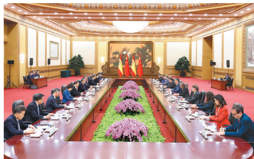
4月14日下午,国务院总理李强在北京人民大会堂同来华进行正式访问的西班牙首相桑切斯举行会谈。

桑切斯表示,西中关系历史悠久,已成为重要合作伙伴。我同习近平主席就两国全面战略伙伴关系发展达成重要共识。西班牙愿同中方密切高水平政治对话,加强战略沟通,增进相互理解,拓展经贸、投资、科技、可再生能源、教育、文化等领域合作,扩大旅游、民间往来,不断增强两国关系的稳定性和