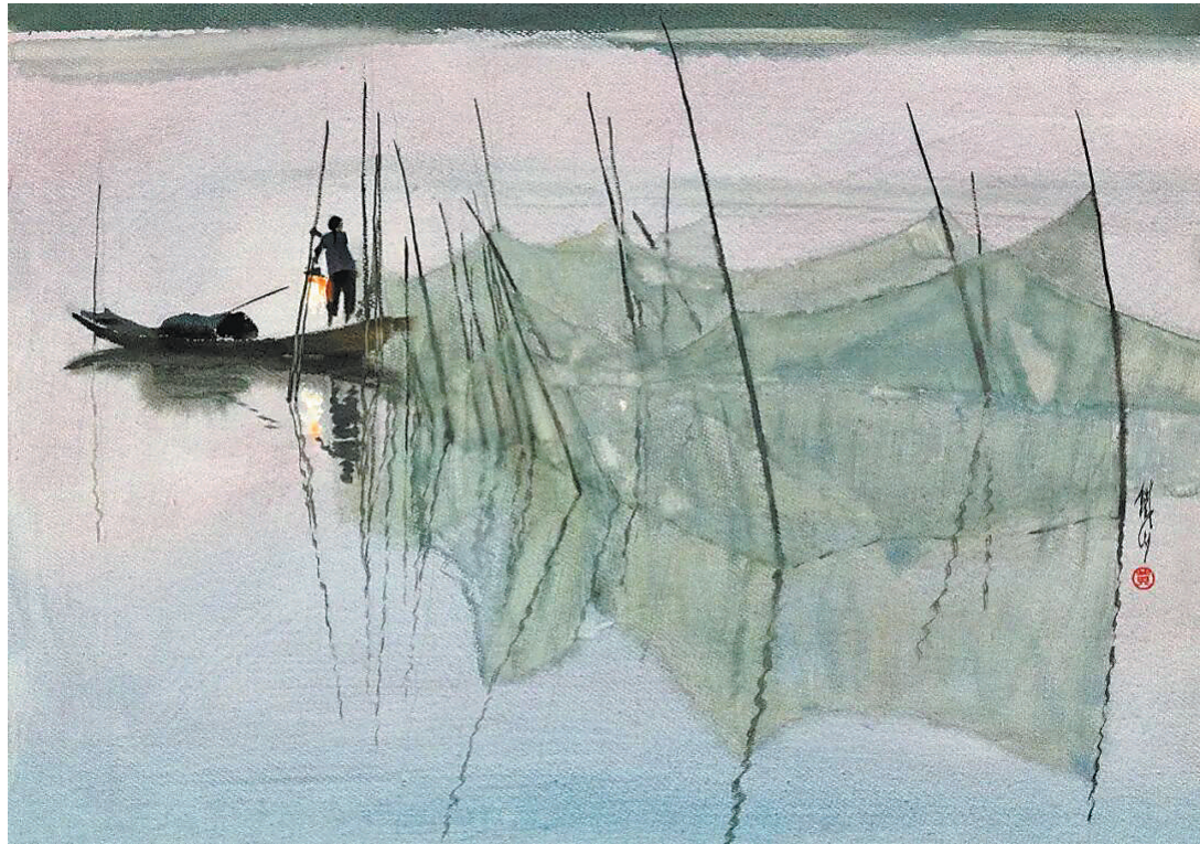
▲水彩《洞庭渔光曲》，作者黄铁山，中国美术馆藏。