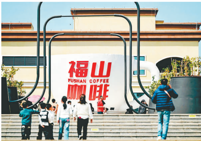
▲福山咖啡文化风情镇一角。资料图片 ◀海南罗布斯塔咖啡果实。资料图片