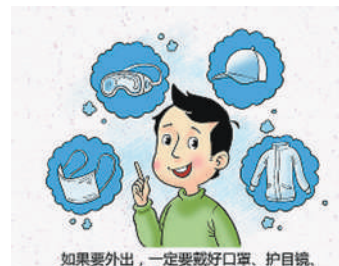
如果要外出,一定要戴好口罩、护目镜、帽子,穿长袖衣服,防止花粉直接接触皮肤及呼吸道,诱发过敏