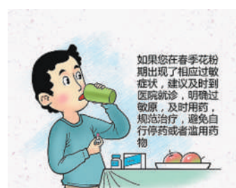
如果您在春季花粉期出现了相应过敏症状,建议及时到医院就诊,规范治疗,避免自行停药或者滥用药物