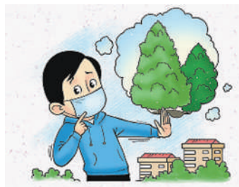
尽量减少在花粉浓度高的时间段外出,远离花草树木密集区域

早诊早治,防止加重。出现反复咳嗽、喘息、胸闷等症状,及时到呼吸科就诊,完善肺功能与过敏原检查,尽早明确诊断,确诊后启动规范化治疗。坚持每日记录症状与呼气峰流速,定期复查肺功能,每3—6个