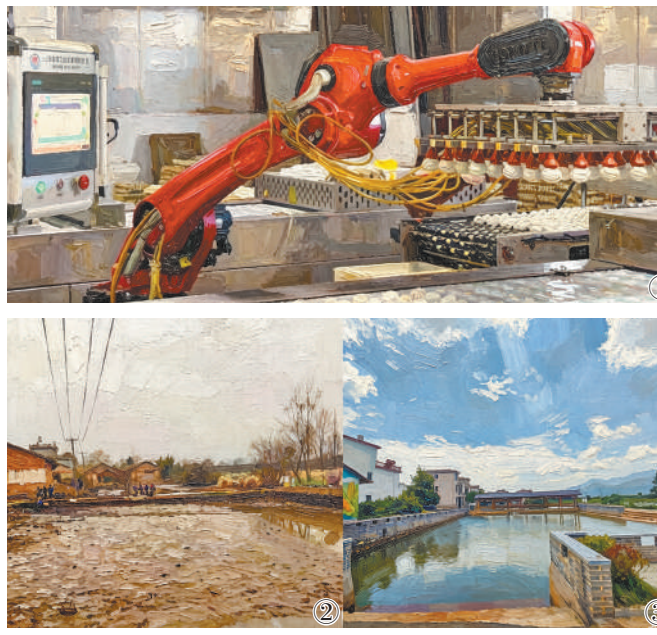
图①:自动化设备在分拣鸭蛋。AI修饰生成油画

如今的碛滩村,柏油路上车辆穿梭,昔日的废弃土地蝶变为生机勃勃的特色产业基地,破败村落早已焕新为宜居宜业的美丽乡村。这座900多岁的古村,靠着现代化产业注入了活力,盘活了资源,更红火了日子。