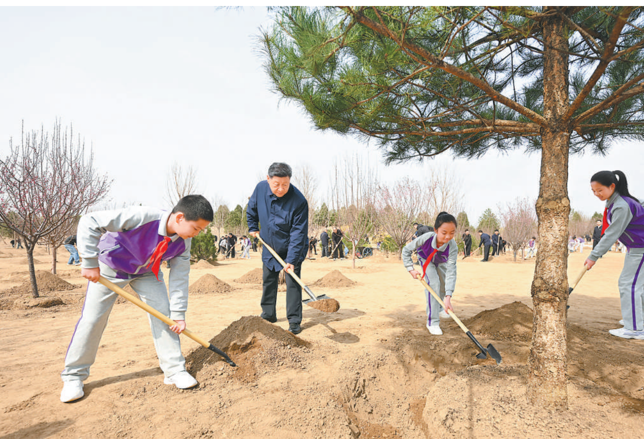
3月30日,党和国家领导人习近平、李强、赵乐际、王沪宁、蔡奇、丁薛祥、李希等来到北京市昌平区百善镇参加首都义务植树活动。这是习近平同大家一起植树。

良好生态人人共享,也需要合力共建。要组织动员全社会广泛参与植树造林,为山川大地增添锦绣,让中国式现代化的底色更加亮丽