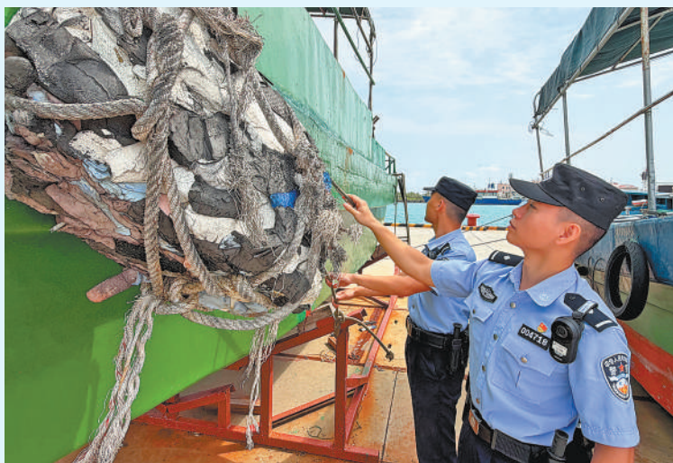
▲民警在检查渔船安全。 ▲民警到永兴社区走访。

在海南省三沙市永兴岛,有一群坚守在这里的戍边民警。海天之间,总能看到他们忙碌的身影。海南省公安厅反走私和海岸管理总队第八支队永兴海岸派出所的民警们,在高温、高湿、高盐的气候环境下,开展巡逻防控,走村入户,服务百姓,默默地守护着一方平安。