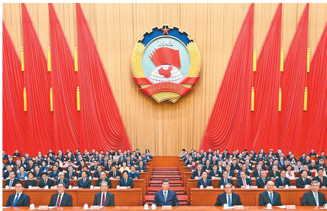
3月4日下午,中国人民政治协商会议第十四届全国委员会第四次会议在北京人民大会堂开幕。这是习近平、李强、赵乐际、蔡奇、丁薛祥、李希、韩正在主席台就座。

王沪宁表示,2025年是中国式现代化进程中具有重要意义的一年。面对错综复杂的国际形势和艰巨繁重的国内改革发展稳定任务,以习近平同志为核心的党中央团结带领全党全国各族人民,迎难而上、奋力拼搏,统筹国内国际两个