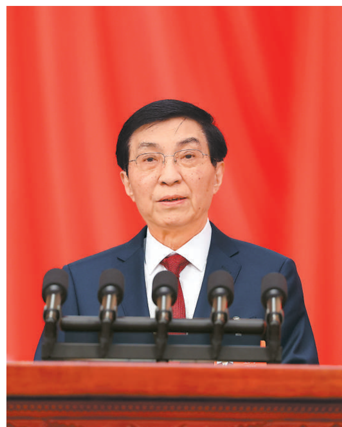
全国政协主席王沪宁代表政协第十四届全国委员会常务委员会,向大会报告工作。新华社记者 姚大伟 摄

人民政协的各党派团体和各族各界人士,为实现“十五五”良好开局广泛凝聚人心、凝聚共识、凝聚智慧、凝聚力量。