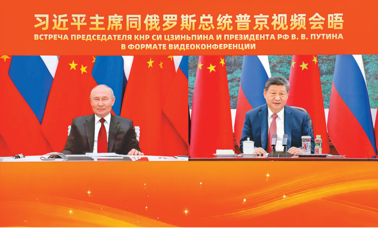
2月4日下午，国家主席习近平在北京人民大会堂同俄罗斯总统普京举行视频会晤。