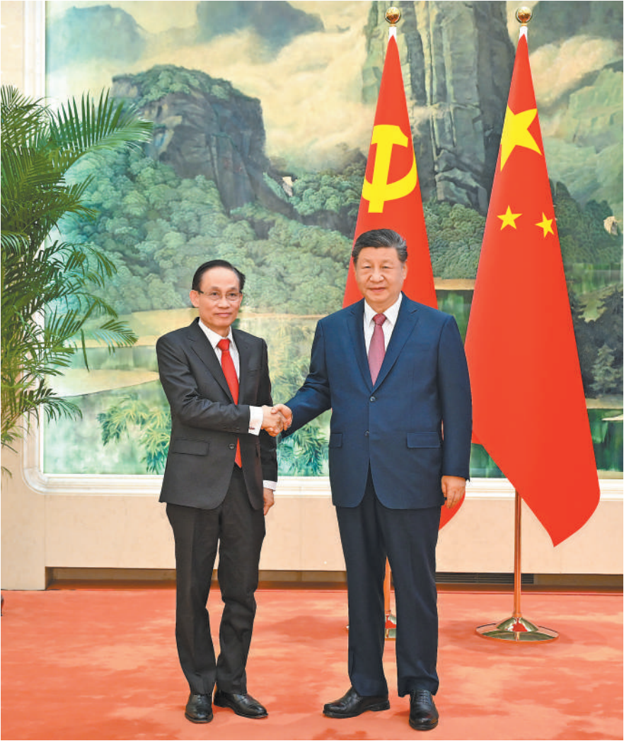
2月4日下午，中共中央总书记、国家主席习近平在北京人民大会堂会见作为越共中央总书记苏林特使专程来访的越共中央政治局委员、外交部长黎怀忠。

新华社北京2月4日电（记者冯歆然）2月4日下午，中共中央总书记、国家主席习近平在人民大会堂会见作为越共中央总书记苏林特使专程来访的越共中央政治局委员、外交部长黎怀忠。 习近平指出，中越两党坚持相互通报彼此重大政治议程的优良传统，体现了中越“同志加兄弟”的特殊友好情谊和高度政治互信。不久前，我同苏林总书记通话，围绕进一步推进具有战略意义的中越命运共同体建设深入交换意见，达成重要共识。相信在以苏林同志为首的越共中央坚强领导下，越南党、国家、人民一定能够胜利完成越共十四大确定的各项目标任务。 习近平强调，中越两国推进社会主义建设各项事业蓬勃发展，向世界昭示了社会主义制度的生机和活力。中方将一以贯之高度重视发展中越关系，愿同越方一道，牢牢把握社会主义前途命运，秉持“十六字”方针和“四好”精神，按照“六个更”总体目标，落实好高层共识，不断弘扬传统友谊，深化各层级交往和各领域合作，妥善管控分歧，推动中越命运共同体建设阔步向前。 黎怀忠转交了越共中央总书记苏林致习近平总书记的复谢函并转达口信，感谢习近平总书记拨冗会见，表示越共十四大开启了越南民族发展新纪元，越方始终将巩固和发展对华关系作为对外政策的头等优先，愿同中方在新的发展征程上携手并进，以两党两国领导人达成的重要共识为引领，进一步巩固政治基础、物质基础和民意基础，推动越中关系迈上新的高度，更多造福两国人民。 王毅参加会见。