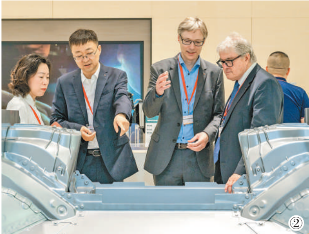
图①:宝马沈阳工厂车身车间的生产线。 图②:德国企业代表来中国参观考察。 图③:贝卡尔沈阳工厂内,技术人员正在进行技术交流。 底图:米其林沈阳工厂鸟瞰图。