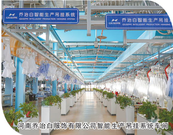
河南乔治白服饰有限公司智能生产吊挂系统车间

电镀生态园破解环保发展难题。针对金属制品、五金加工等传统产业电镀环节的环保瓶颈，虞城县高标准建设专业化电镀生态园。园区实行污染集中治