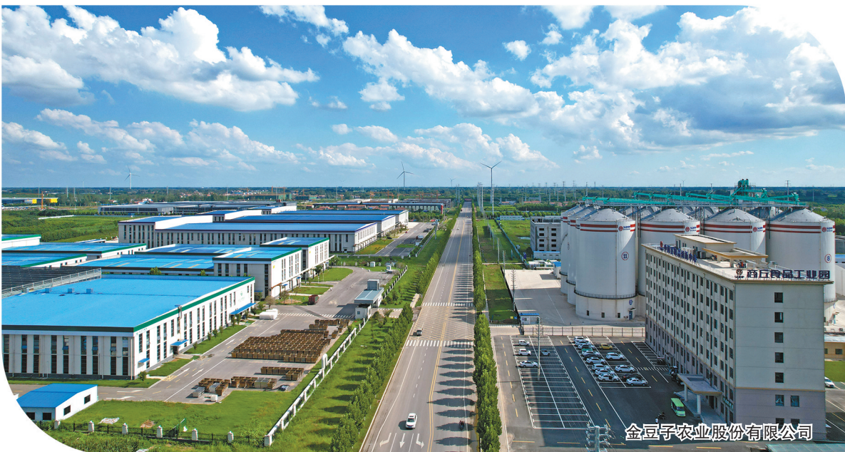
金豆子农业股份有限公司