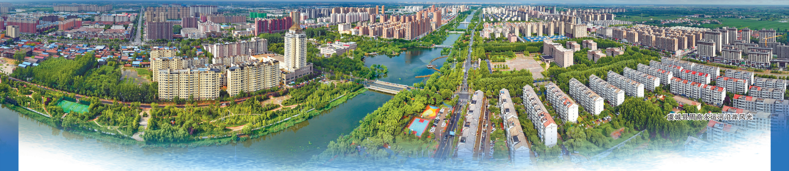
虞城县周商永运河沿岸风光