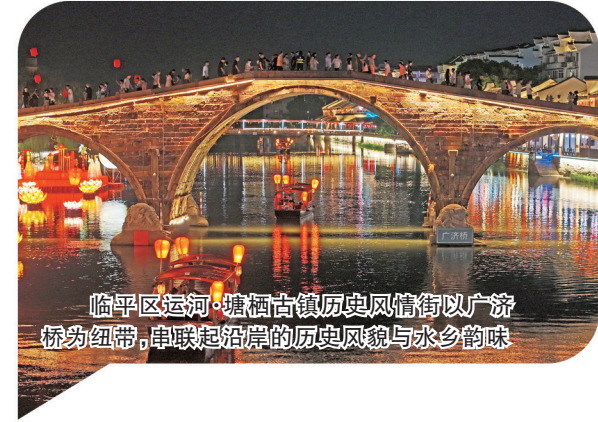
临平区运河·塘栖古镇历史风情街以广济桥为纽带，串联起沿岸的历史风貌与水乡韵味