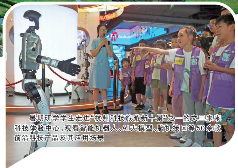
暑期研学学生走进“杭州科技旅游新十景”之一的文三未来科技体验中心，观看智能机器人、AI大模型、脑机接口等50余款前沿科技产品及其应用场景