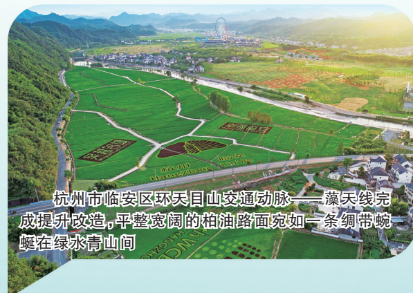
杭州市临安区环天目山交通动脉——藻天线完成提升改造，平整宽阔的柏油路面宛如一条绸带蜿蜒在绿水青山间

实践站点建设，截至今年11月底，全市123个站点实际进站青年1232人，带动2.3万名农户和246个村集体经济增收1.85亿元，城乡要素双向流动的良好格局加速形成。