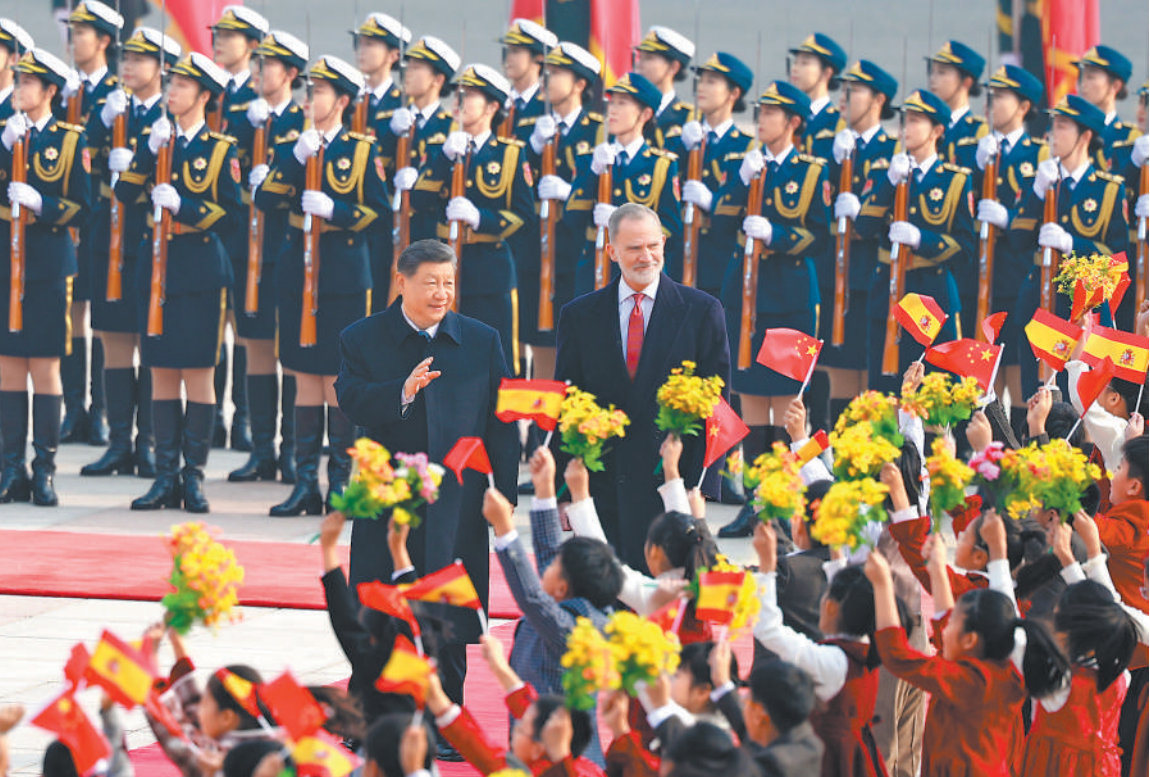
十一月十二日上午，国家主席习近平在北京人民大会堂会见来华进行国事访问的西班牙国王费利佩六世。这是会见前，习近平在人民大会堂东门外广场为费利佩六世举行欢迎仪式。

新华社北京11月12日电（记者冯毅然）11月12日上午，国家主席习近平在北京人民大会堂会见来华进行国事访问的西班牙国王费利佩六世。 习近平欢迎费利佩六世国王访华，指出中国和西班牙都有深厚的历史文化底蕴。建交50多年来，两国坚持从战略高度和长远角度看待和发展双边关系，相互尊重、相互支持、相互成就，树立了不同历史文化、不同社会制度国家友好相处、共谋发展的典范，也为推动全球开放合作、维护国际公平正义发挥了重要作用。西班牙王室为中西关系发展作出了突出贡献。在两国迎来建立全面战略伙伴关系20周年之际，费利佩六世国王对中国进行国事访问，对推动两国友好合作不断向前发展具有重要意义。 习近平强调，中方珍视同西班牙的传统友好，重视西班牙在国际和地区事务中的独特作用，愿同西班牙一道，携手打造更有战略定力、更富发展活力、更具国际影响力的全面战略伙伴关系。双方要进一步坚定相互支持，保持高层交往势头，加强战略引领，确保两国关系始终走在正确道路上。要进一步推进务实合作，中方愿进口更多西班牙优质产品，挖掘新能源、数字经济、人工智能等新兴领域合作潜力，扩大相互投资，