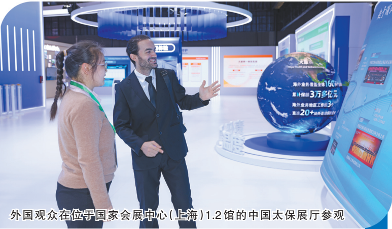
外国观众在位于国家会展中心(上海)1.2馆的中国太保展厅参观

在本届进博会期间,中国太保寿险联合复旦大学在中国太保展台举办“长护新时代,共享未来”发布会,共同发布长期护理保险课题研究成果,分享国际视野下长期护理保险的全球经验。太平洋健康险举办了以“开放共赢,健康未来”为主题的团体商业健康保险高质量发展论坛,汇聚各方力