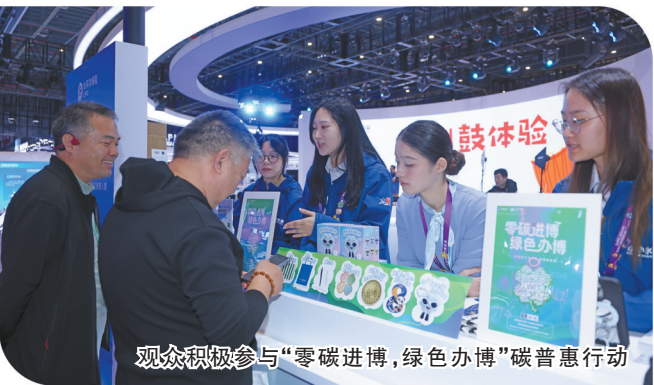
观众积极参与“零碳进博,绿色办博”碳普惠行动