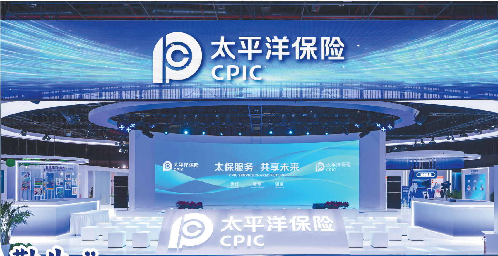
第八届进博会中国太保展厅

自2018年首届中国国际进口博览会(简称“进博会”)举办以来,中国太平洋保险(集团)股份有限公司(简称“中国太保”)已连续八届深度参与进博会,立足上海主场、发挥太保优势、讲述中国故事、迎接全球来宾。 作为本届进博会高级合作伙伴和指定保险服务商,中国太保提供“产、寿、健”一站式综合保险保障方案和一体化风险管理服务,保险保额提升至超1.28万亿元。本届进博会首日,中国太保1000平方米的智慧康养展台亮相进博会医疗器械及医药保健展区;以“八方共聚,领取未来”为主题的2025中国太保客户节亮相进博会,作为客户节的重要组成部分,3场高水平论坛暨子客户节精彩呈现,通过线上线下融合的形式,打造一场集战略互动、主题论坛、专业交流、生态联结于一体的高水平活动,为行业交流合作搭建了高质量平台,全力支持进博会办出水平、办出成效、越办越好。