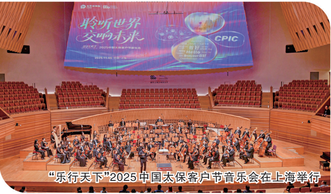
“乐行天下”2025中国太保客户节音乐会在上海举行