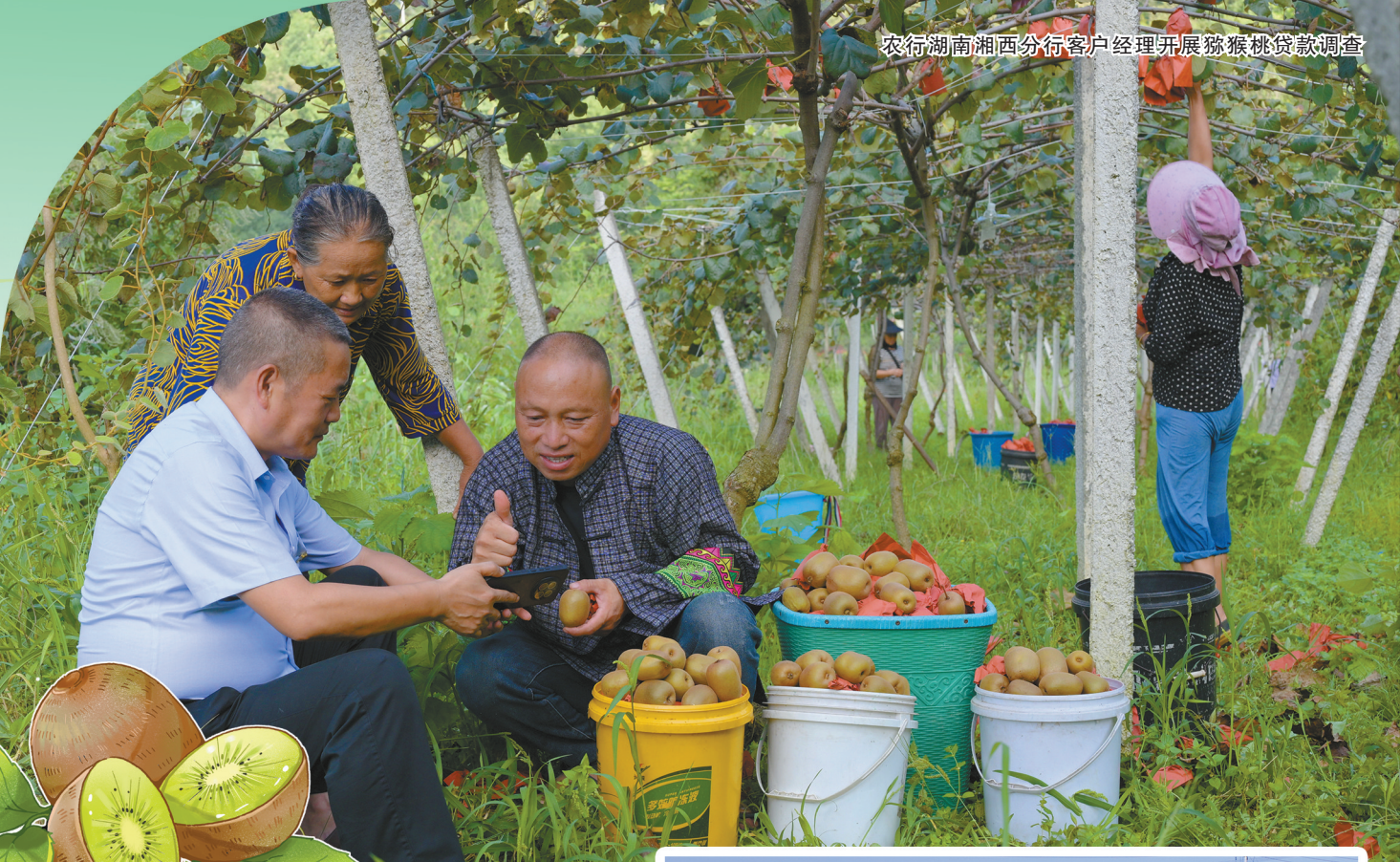
农行湖南湘西分行客户经理开展猕猴桃贷款调查