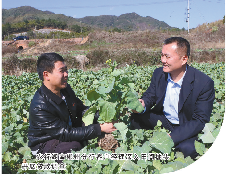
农行湖南郴州分行客户经理深入田间地头开展贷款调查

今年春天，湖南省湘西土家族苗族自治州保靖县黄金村的千亩茶园长势良好，为近年来最佳。但对于佳茗茶叶种植专业合作社，按照往年的收购量，却需要额外准备80万元周转资金，否则茶农的鲜叶将面临滞销风险。