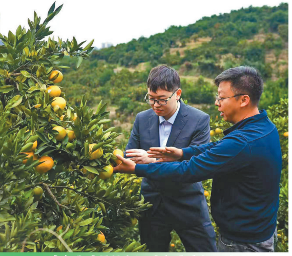
农行湖南邵阳洞口支行客户经理在当地柑桔园开展贷款调查