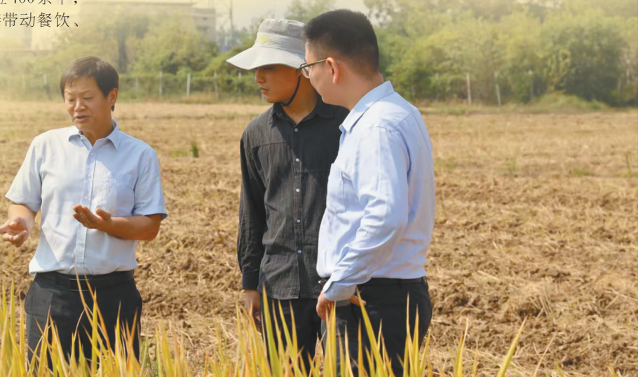
农行湖南长沙支行客户经理查看水稻生长情况