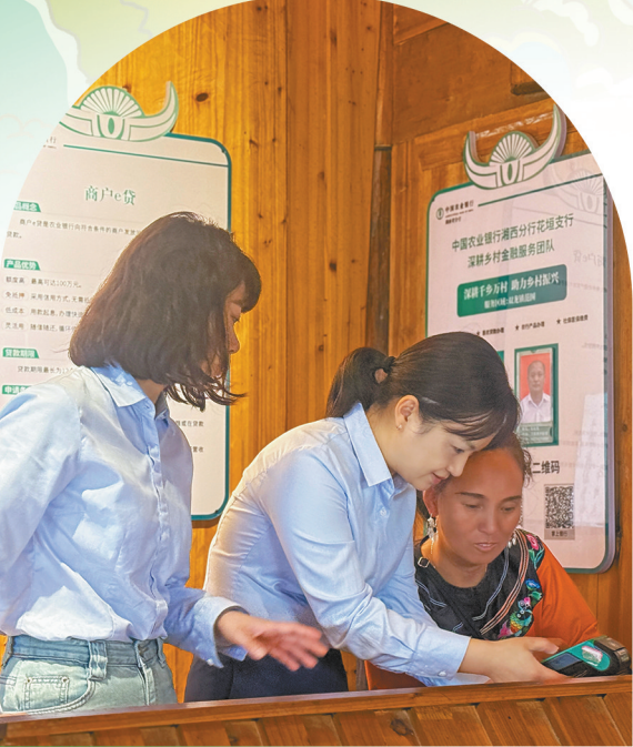
农行湖南湘西分行工作人员在十八洞乡村振兴金融服务站开展宣传