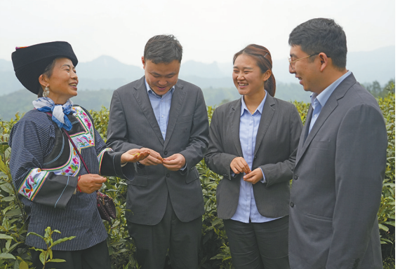
农行湖南湘西保靖支行客户经理向客户介绍“茶叶贷”